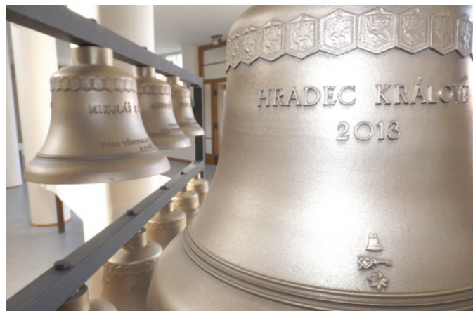
Většina zvonů nese jména historických osobností, ale první je pojmenovaný po našem městě.

i firem, na transparentní účet číslo 4862517001/5500, variabilní symbol 329. „Všem patří velký dík,“ uvedl za organizátory královéhradecký biskup Církve československé husitské Pavel Pechanec a dodal, že přispívat je možné stále. „Zbývající částka ve výši dva miliony 150 tisíc korun bude zapotřebí na automatický hrací systém, elektronické zabezpečení zvonohry, kabinu carillonéra s elektroinstalací,