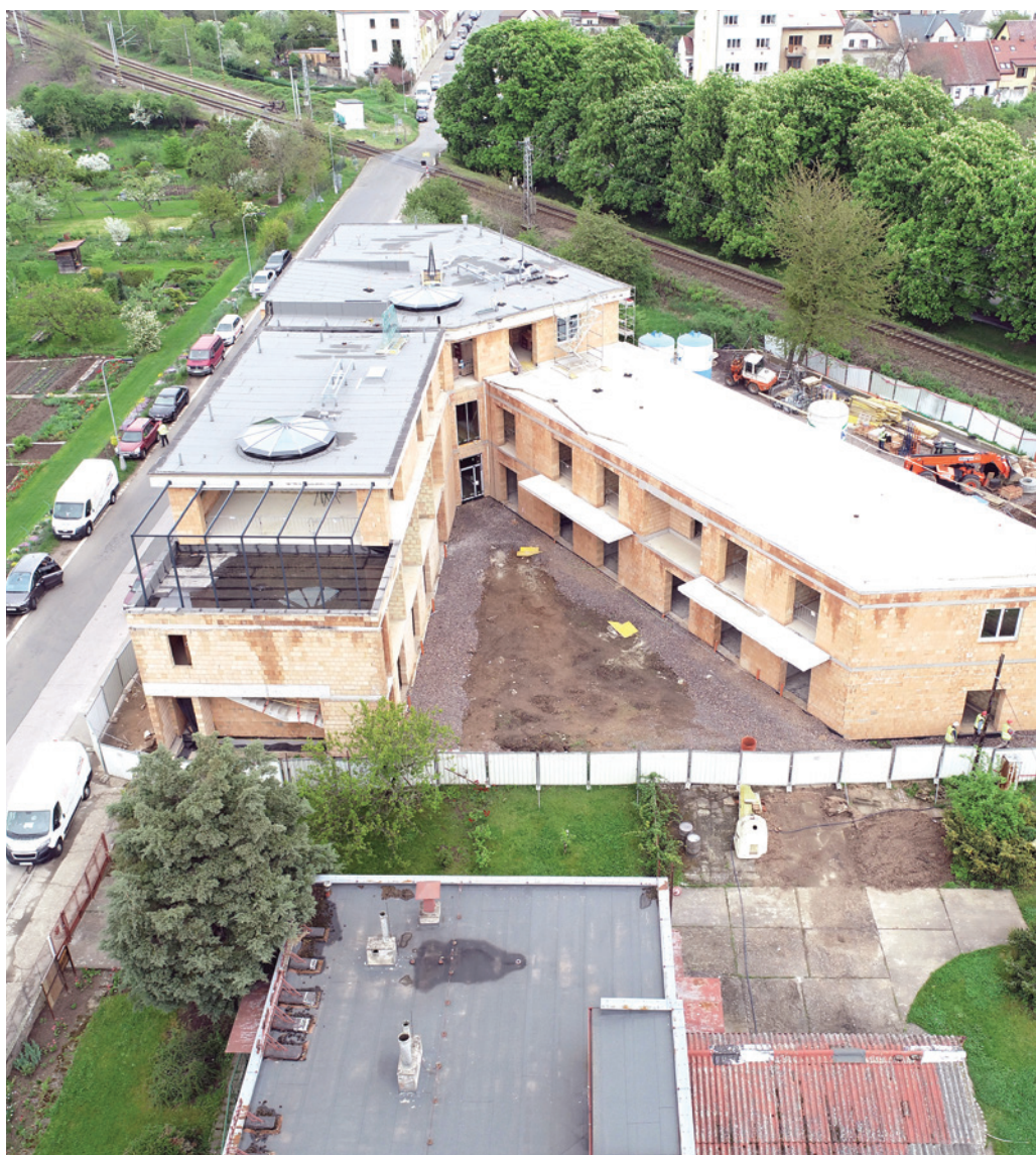
Stavba odlehčovací služby v Honkově ulici, která byla zahájena v květnu loňského roku, zatím pokračuje podle plánu. Aktuálně stavbaři ukončují práce na osazení venkovních výplní otvorů a zahájili práce na venkovních fasádách.