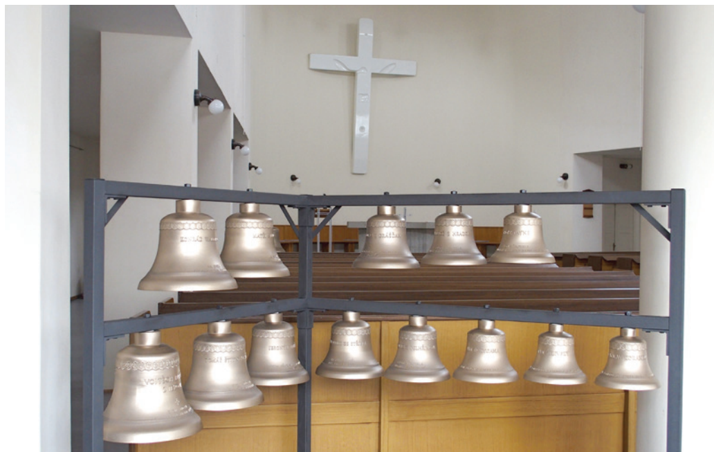
Pro unikátní zvonohru je už ulito padesát zvonů a zvonků i jejich srdcí, část je umístěna v přízemí Sboru kněze Ambrože.

zozemskou firmou Koninklijke Eijsbouts B. V., v jejíž zvonárně zvony odléval. Hradecká koncertní zvonohra by měla být po dokončení druhou v Česku. Zatím jediná, kterou tvoří 27 zvonů, je umístěna v pražské Loretě. Více informací o hradecké zvonohře na www.zvonohrahradeckra-love.cz . // Martin Černý