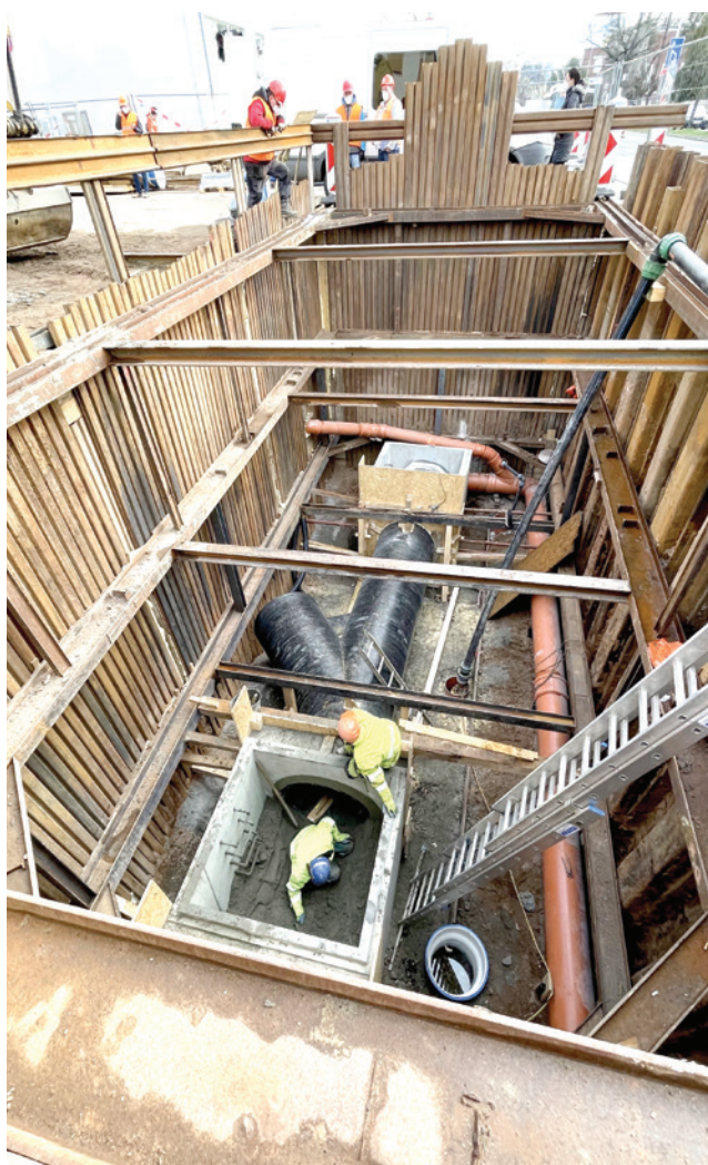
Až šest metrů hluboké výkopy byly potřeba na stavbě kanalizace v ulici Za Škodovkou.

Infoservis o probíhajících a plánovaných opravách kanalizace a vodovodu a o připravovaných investičních akcích společnosti Vodovody a kanalizace Hradec Králové