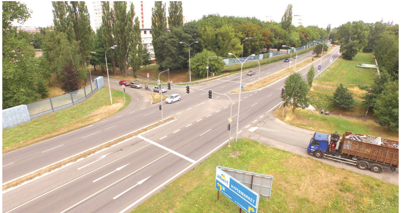
S výstavbou protihlukových stěn na Rašínově třídě začne Ředitelství silnic a dálnic 24. května. Stěny sníží hlukovou zátěž, kterou denně způsobuje více než 30 tisíc projíždějících aut.